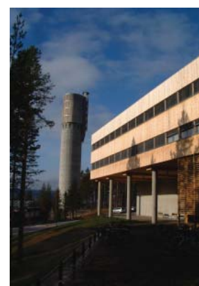
Vanntårnet fra øst