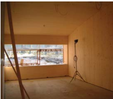
pasientrom i massivtre

Bygget er utformet med to parallelle fløyer med midtkorridor. I den ene fløya ligger behandlingsrom og kontorer for helsepersonell. I den andre fløya ligger 12 pasientrom for tilsammen 36 pasienter. Adkomsten er lagt langs administrasjonsfløya som en arkade som også fungerer som ovedekket venteeareal ved inntrykk og andre massemønstringer. Taket er utformet med svak hvelving og tekket med torv.